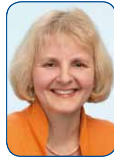
Liebe Leserin, lieber Leser,

auch diese Ausgabe des Merkur Journals hält wieder viel Neues und Interessantes von unseren drei Schulstandorten Karlsruhe, Mannheim und Pforzheim für Sie bereit.