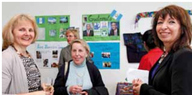
Im Anschluss an die Feierstunde war Gelegenheit zum Ausstellungsbesuch und gemütlichen Beisammensein.