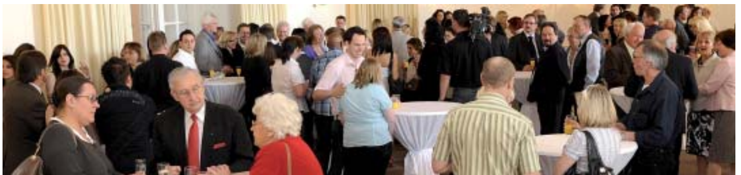
Anregende Gespräche im Gartensaal des Mannheimer Schlosses.