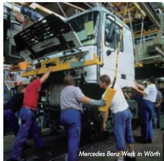
Mercedes-Benz-Werk in Wörth